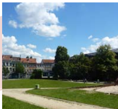
Le parc Rasquinet, au cœur du périmètre du contrat de quartier Josaphat

Il faudra donc encore de la patience et de l' opiniâtreté pour faire bouger les choses mais la décision d'investir à cet endroit est une bonne chose, demandée par le cdH depuis longtemps. Car si nous avons défendu le principe du contrat de quartier d'Helmet – qui démarre, lui, cette année –, nous avons également mis en évidence le manque d'investissements publics dans ce quartier situé à la frontière de Saint-Josse.